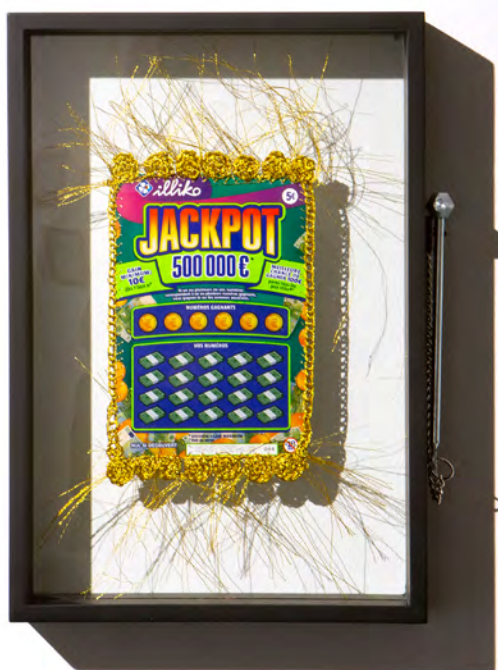
Ticket à gratter brodé par les artistes Cécile Hupin & Katherine Longly, constituant le lot de la tombola d'ouverture de l'exposition. Ticket à gratter, fil, cadre et marteau brise-vitre. Just My Luck . © Cécile Hupin & Katherine Longly