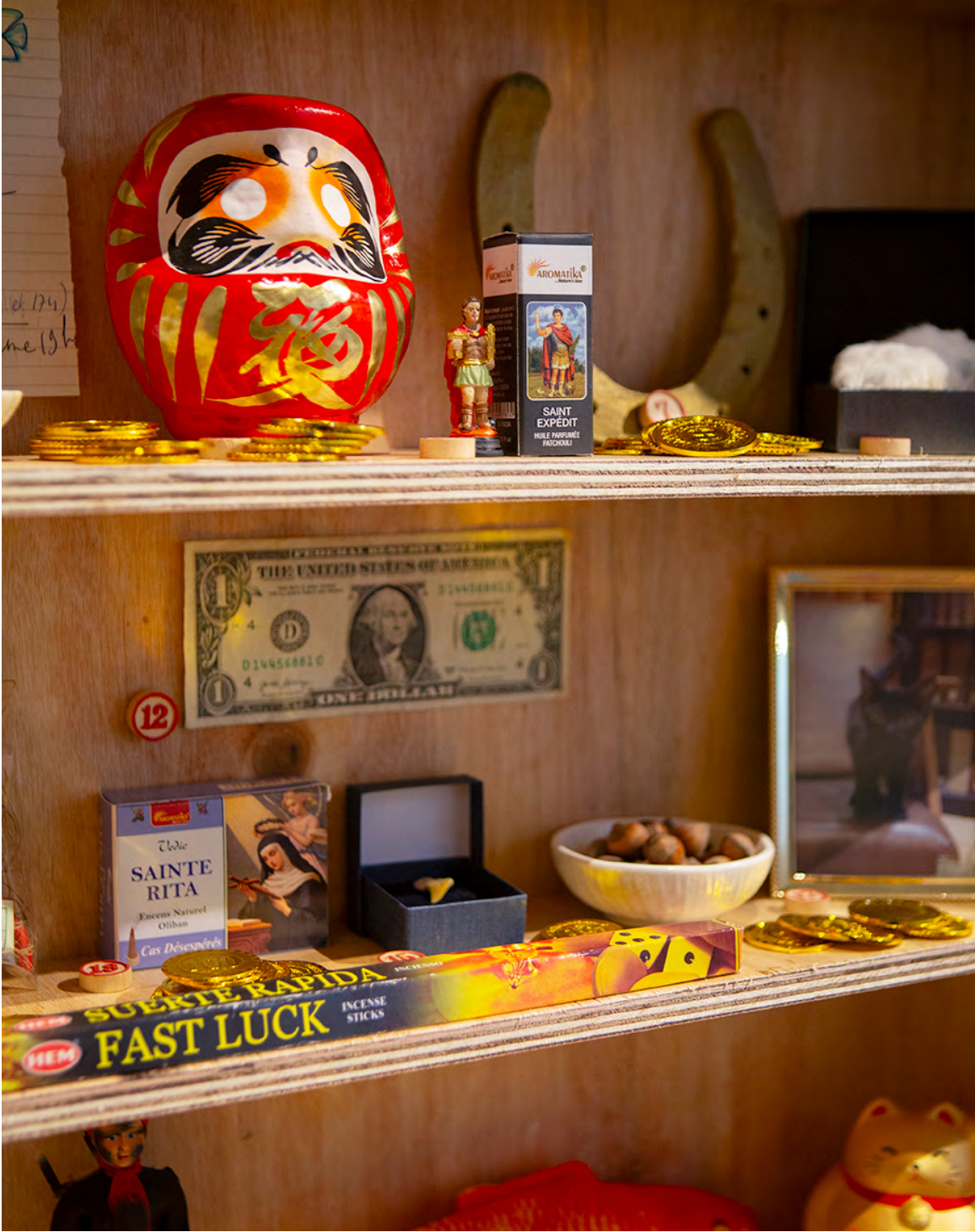
L'autel de la chance - Just My Luck . © Cécile Hupin & Katherine Longly