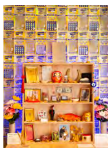
L'autel de la chance - Just My Luck .