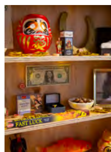
L'autel de la chance - Just My Luck .