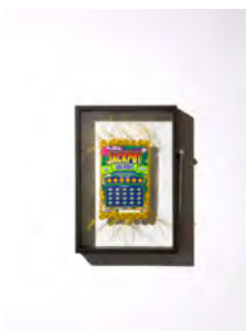
Ticket à gratter brodé par les artistes Cécile Hupin & Katherine Longly, constituant le lot de la tombola d'ouverture de l'exposition. Ticket à gratter, fil, cadre et marteau brise-vitre. Just My Luck . © Cécile Hupin & Katherine Longly