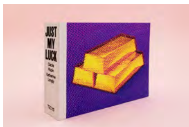
Just My Luck , livre de Cécile Hupin & Katherine Longly publié aux éditions The Eriskay Connection. © Cécile Hupin & Katherine Longly / The Eriskay Connection. Photo : DR