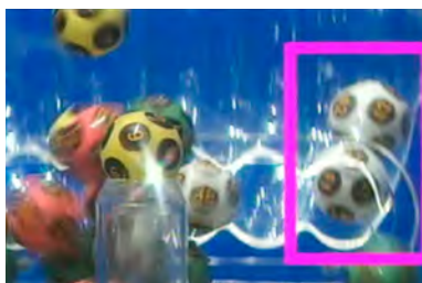
Screenshot montrant les boules 41 et 42 coincées - Just My Luck .