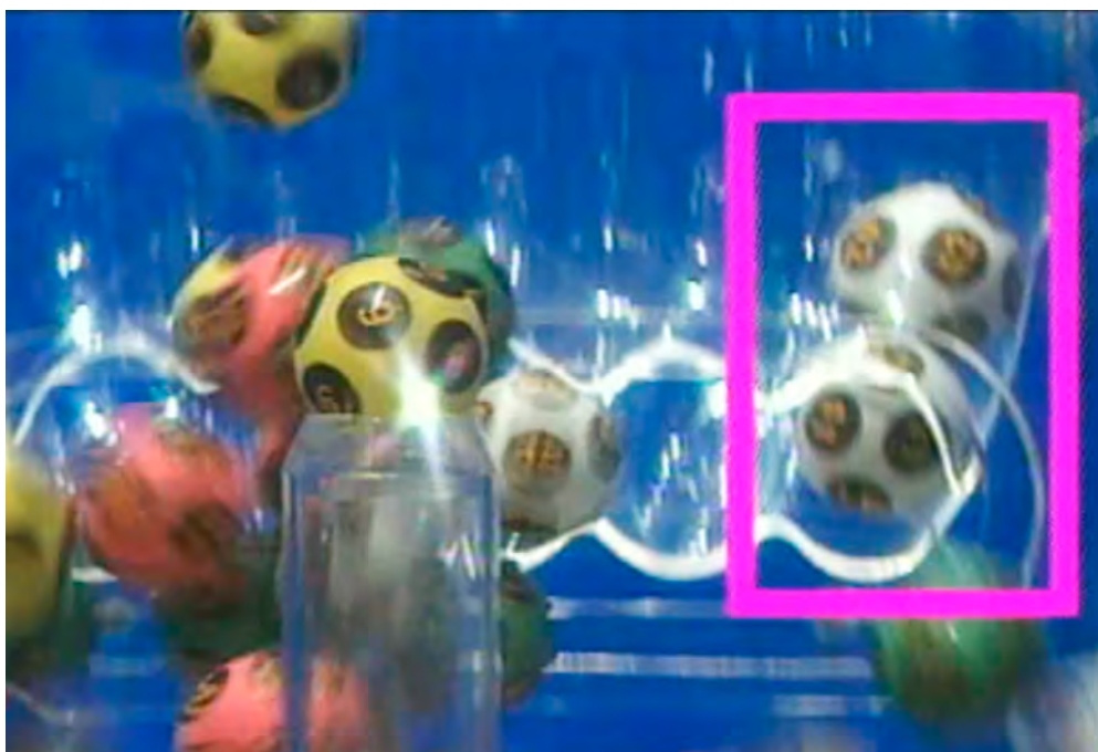
Screenshot montrant les boules 41 et 42 coincées - Just My Luck .