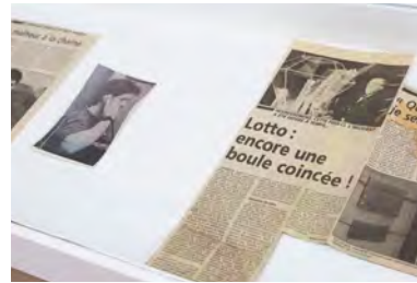
Just My Luck © Cécile Hupin & Katherine Longly