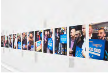
Just My Luck © Cécile Hupin & Katherine Longly