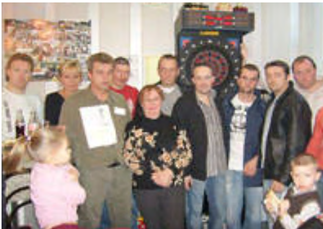
Les Zéromillionnaires - Just My Luck .