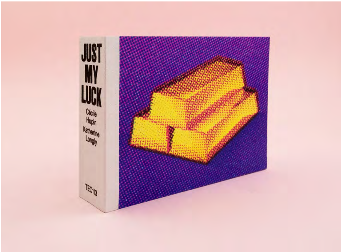
Just My Luck , livre de Cécile Hupin & Katherine Longly publié aux éditions The Eriskay Connection. © Cécile Hupin & Katherine Longly / The Eriskay Connection. Photo : DR