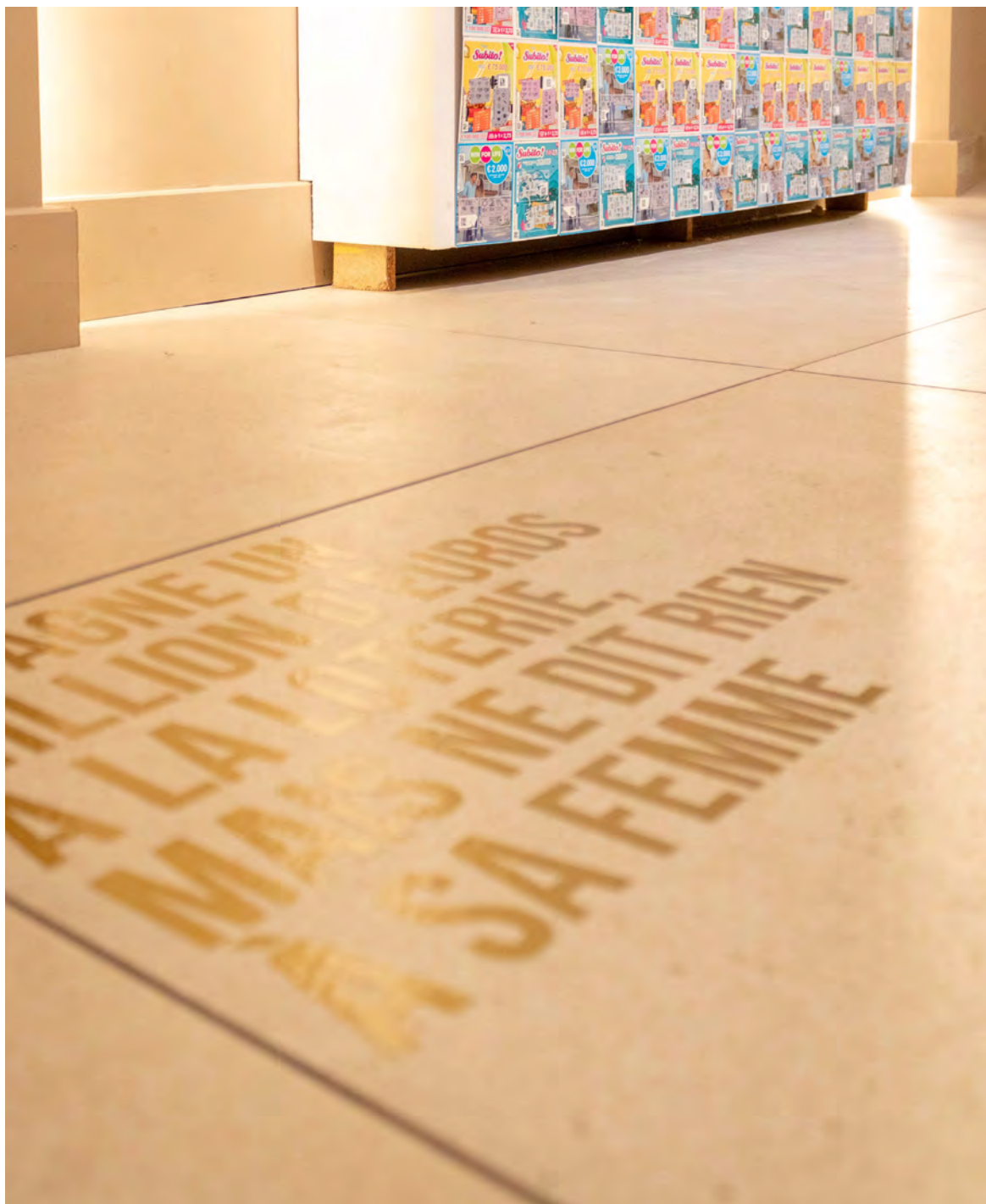
Vue de l'exposition Just My Luck au Théâtre du Nord. © Cécile Hupin & Katherine Longly.