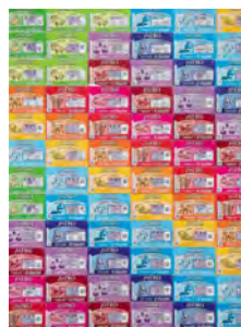
Just My Luck © Cécile Hupin & Katherine Longly