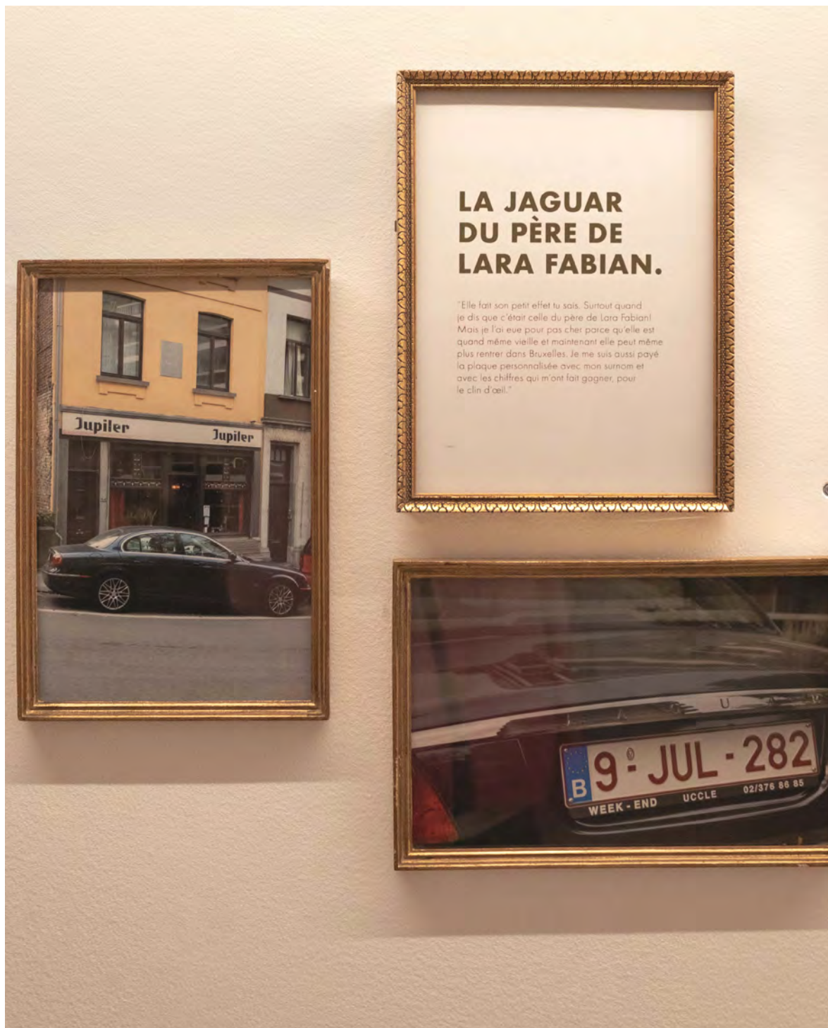
Vue de l'exposition Just My Luck au Théâtre du Nord. © Cécile Hupin & Katherine Longly.