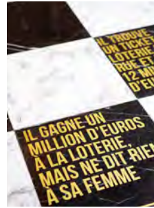
Just My Luck © Cécile Hupin & Katherine Longly