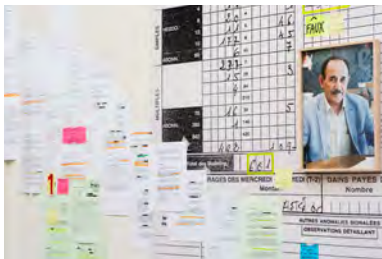
Just My Luck © Cécile Hupin & Katherine Longly