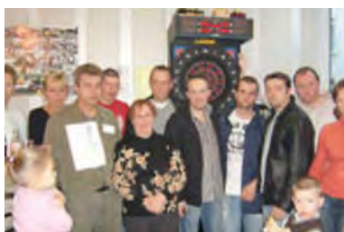
Les Zéromillionnaires - Just My Luck .