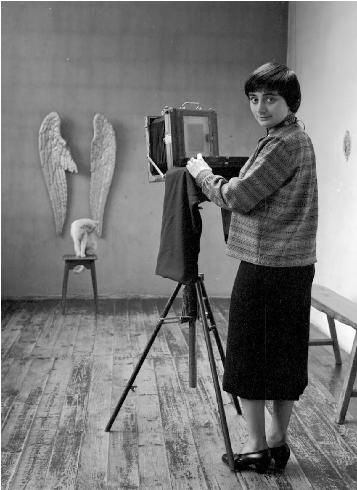
Agnès Varda, Agnès Varda avec une chambre photographique 13x18 cm, dans son studio rue Daguerre, vers 1954-1955, d'après négatif 6x6 cm.