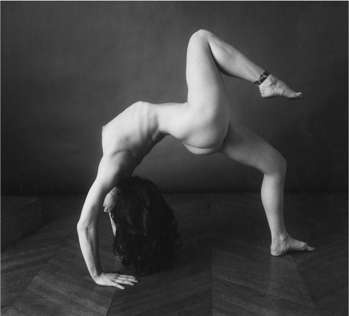
Bettina Rheims, Female Trouble, La Roue , Mars 1981, Paris.