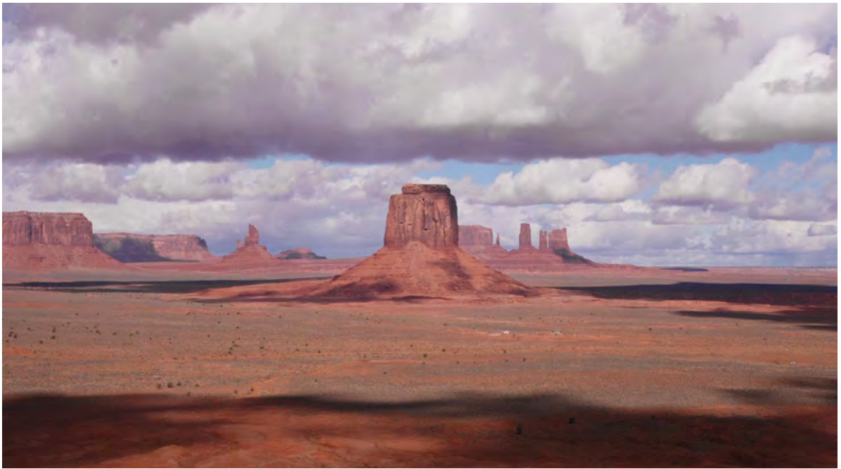
Théodora Barat, Proving Ground Zero , 2021.