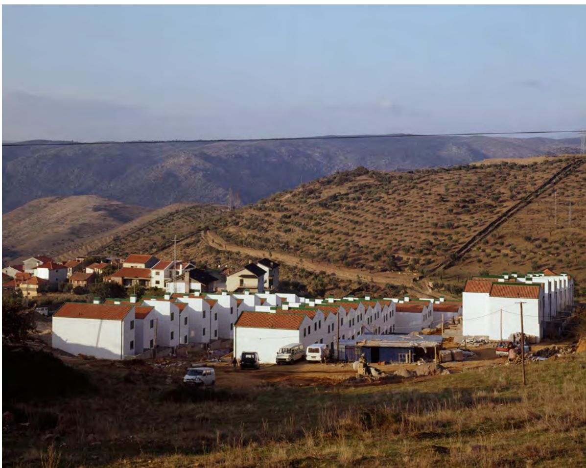
Jean-Louis Schoellkopf, Portugal, les villages (destruction) , 1990. Diapositive à développement chromogène © Jean-Louis Schoellkopf – Institut pour la photographie

Pour L'automne à l'Institut , la reproduction en wallpaper d'un négatif intitulé Portrait d'un habitant du quartier Côte-Chaude , vers 1980 a été exposé dans la salle consacrée aux fonds.