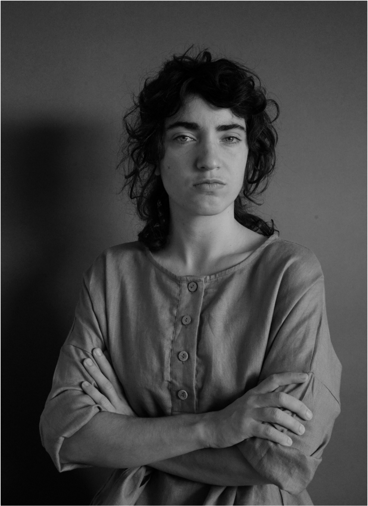
Agnès Geoffroy, Les orageuses © Agnès Geoffroy, 2023