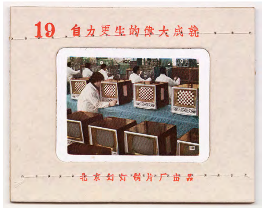
A Great Accomplishment of Regeneration , 1965, offset print color transparency.