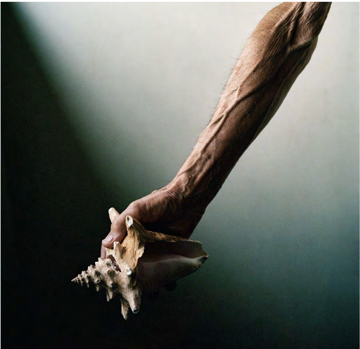
Christian Lafosse, Le Rocher aux Hironnelles , 2023. « Rose Nacre » / Photographie argentique