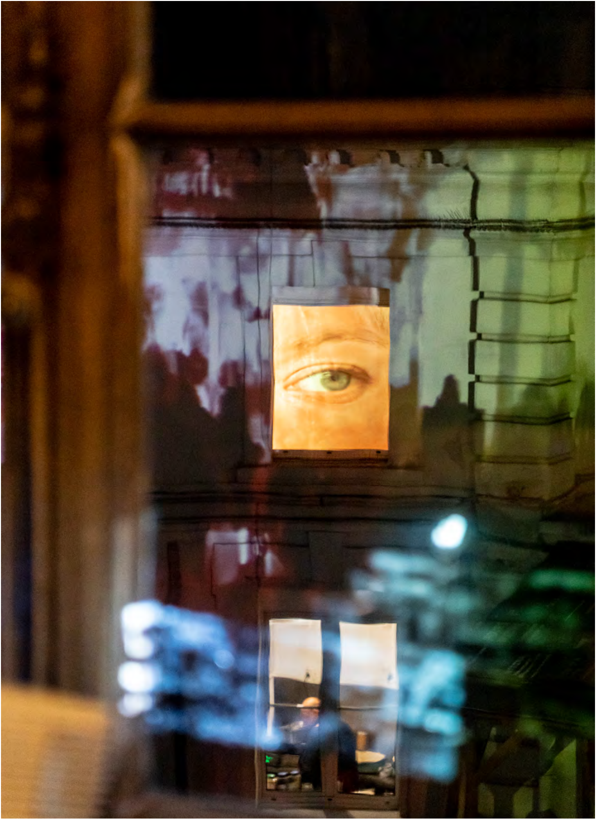
Bertrand Gadenne, Les Yeux , 2023.