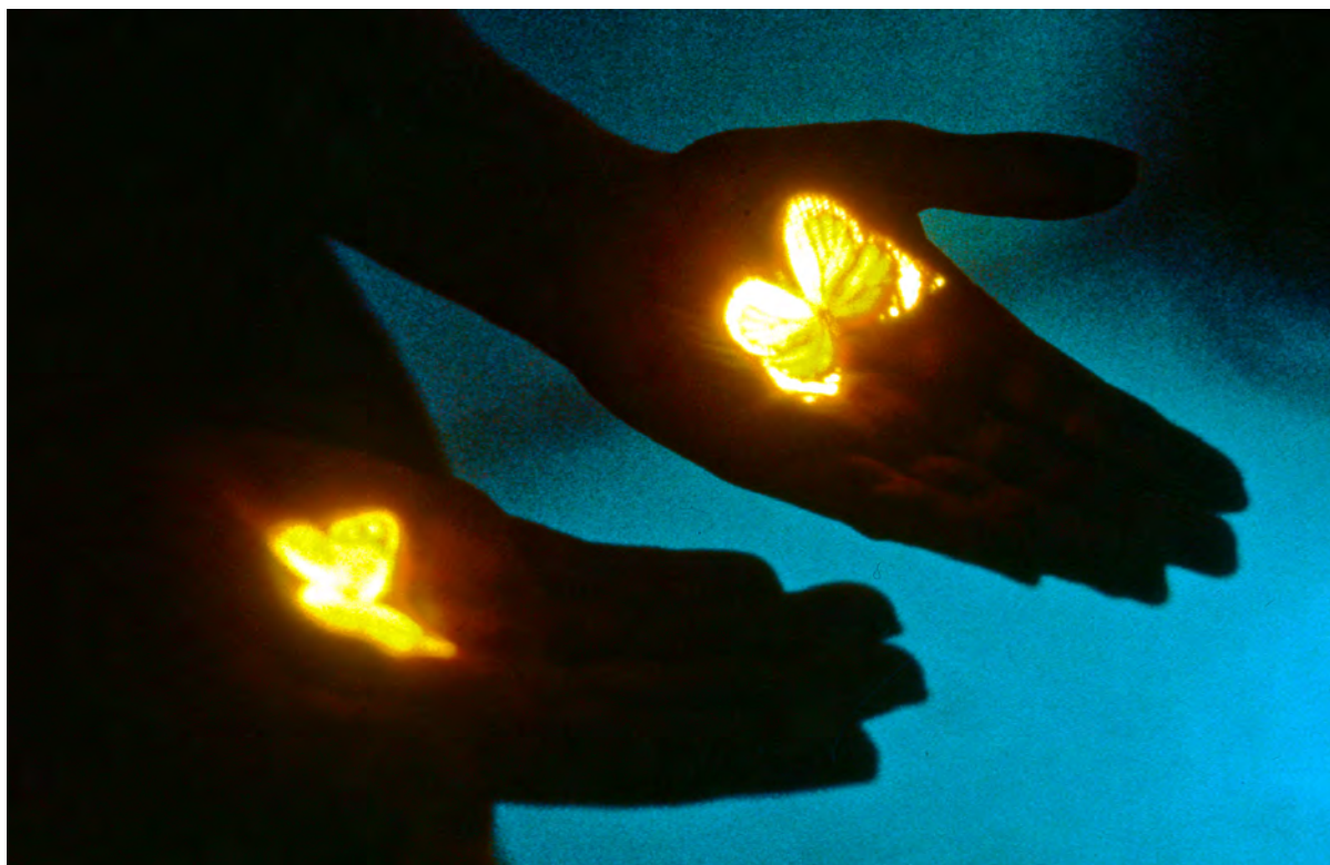
Bertrand Gadenne, Les Papillons , 1988, Installation avec projection aérienne d'une diapositive. © Bertrand Gadenne

Le printemps à l'Institut pour la photographie a accueilli 10 643 visiteurs, dont 9 599 individuels en un peu plus de deux mois.