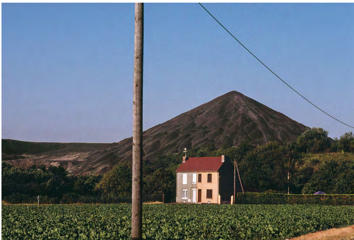
Harry Gruyaert, NORD , Picardie, 1991 © Harry Gruyaert, 2023