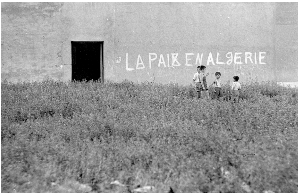
Agnès Varda, Marseille 1956 .