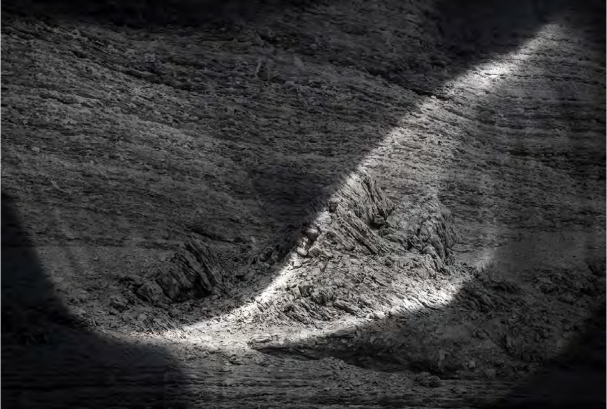
Sarah Ritter, Soleils fantômes , Vague, reflet, lumière naturelle, 2022 © Sarah Ritter, 2023