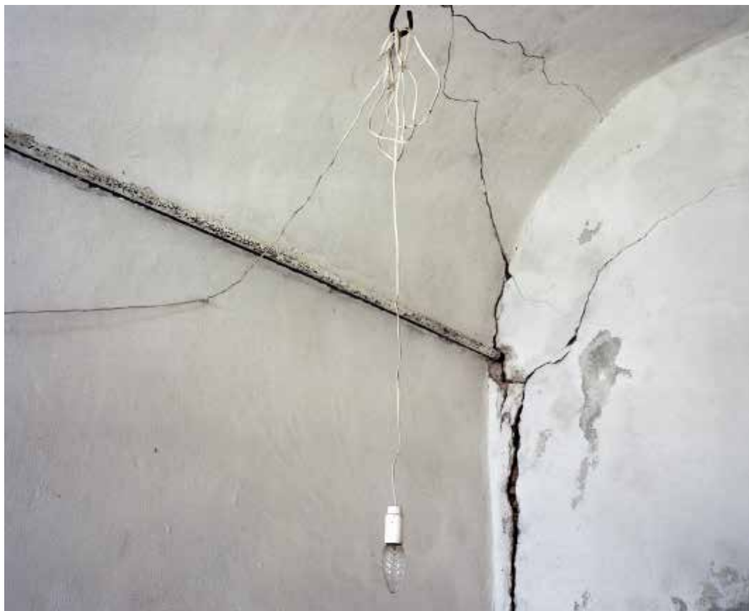
Ezio D'Agostino True Faith 2019