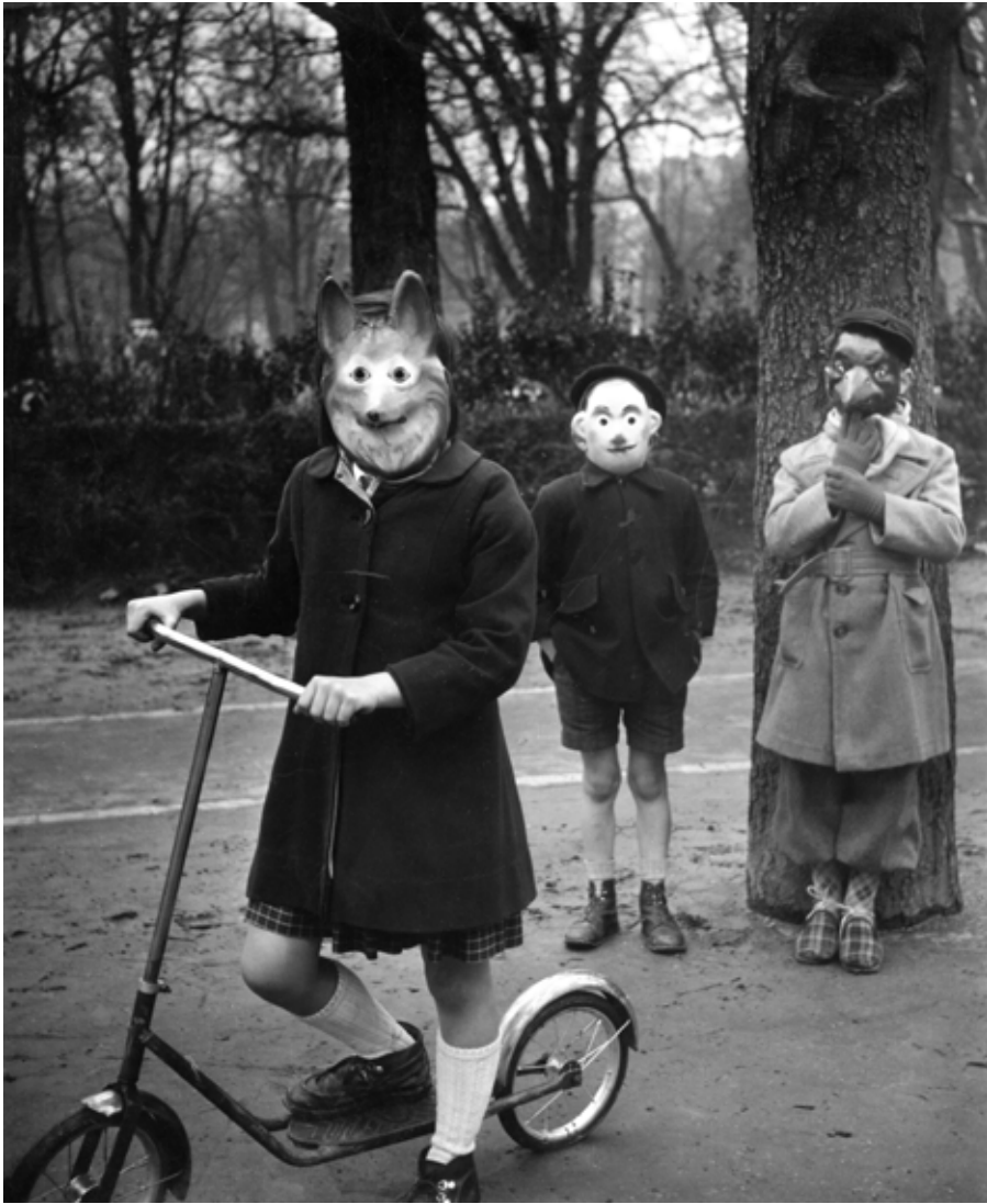
Agnès Varda Les enfants masqués 1953