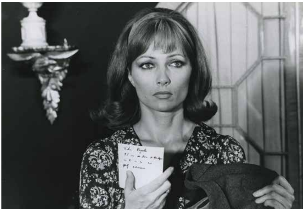
Pierre Zucca La femme infidèle 1969